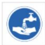
Lavarse las manos