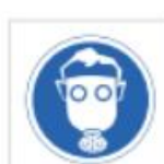
Uso de máscara