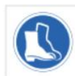
Uso de botas