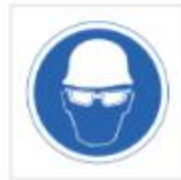
Uso de casco y gafas