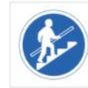
Utilizar el pasamanos