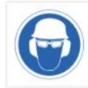
Uso de casco, gafas y protectores auditivos