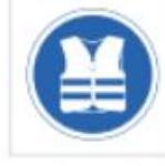
Uso de ropa de alta visibilidad