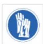
Uso de guantes aislantes