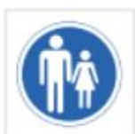
Paso de peatones