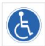
Uso de minusválidos