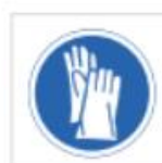
Uso de guantes