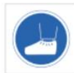
Uso de calzas