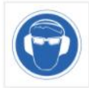
Uso de gafas y protectores auditivos