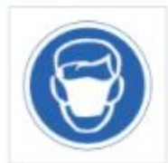
Uso de mascarilla