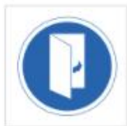
Mantener la puerta cerrada