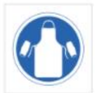
Uso de delantal y manguitos