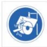
Uso de protector