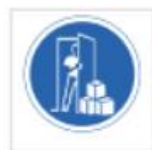
Mantener libre el paso