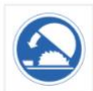
Uso de protector ajustable