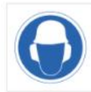
Uso de casco y protectores auditivos