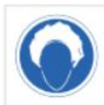
Uso de gorro higiénico