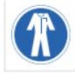
Uso de ropa protectora