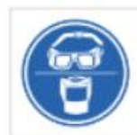
Uso de gafas o pantalla