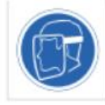
Uso de pantalón