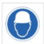
Uso de casco