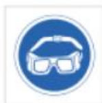
Uso de gafas antisalpicadura